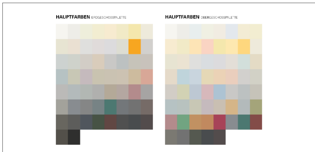
Abb. 2: Die Hauptfarben wurden je Geschoss ermittelt, hier eine Aufstellung der Töne ohne Mehrfachnennung.

Die Forschung wurde in zwei Schritten durchgeführt. Zunächst dokumentierte die Verfasserin das aktuelle Farbspektrum von Solingen-Ohligs, indem sie Farbabnahmen an den Gebäuden durchführte. Danach sind die Haupt- und Nebensfarben der Fassaden und Fenster in verschiedenen Geschossezonen erfasst wurden (vgl. Abb. 2, 3).