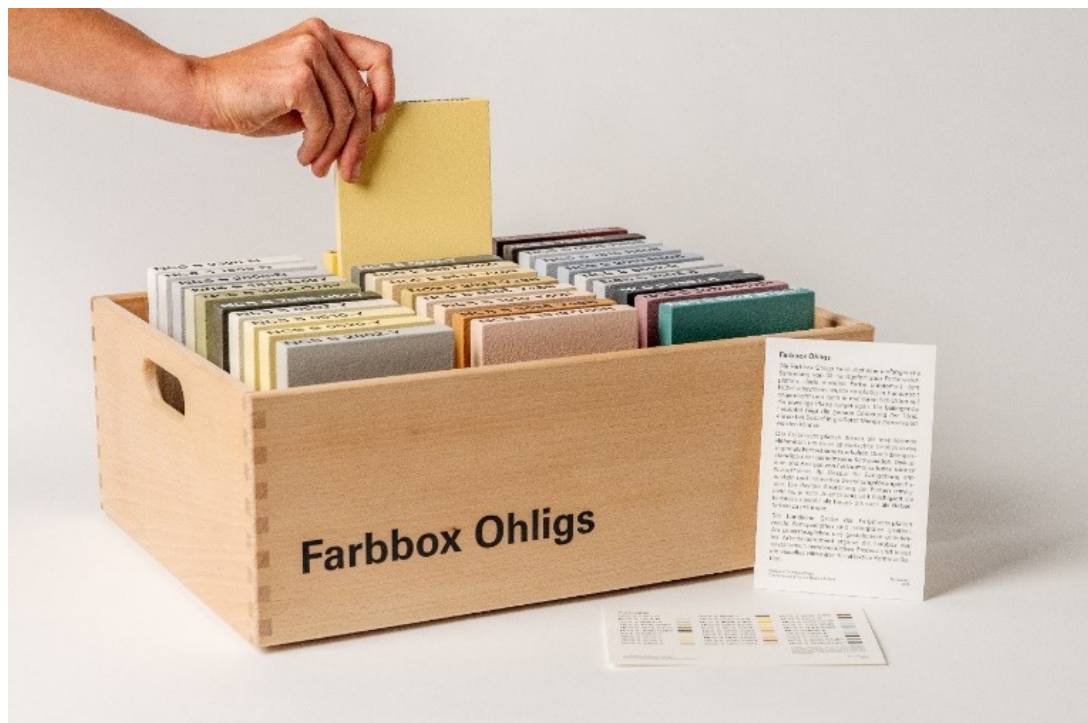
Abb. 4: Mit der Farbbox Ohligs können sich Interessierte dem Lokalkolorit spielerisch nähern

Die gewonnenen Erkenntnisse über die Farbkultur in Solingen-Ohligs führten zu einer Auswahl von Farbtönen und Nuancen, die als Inspiration für zukünftige Farbentscheidungen dienen können. Bei der Zusammenstellung dieser Farbpalette sind bewusst bereits vorhandene Farben ausgewählt wurden, um aufzuzeigen, wie aus der bestehenden Farbkultur ein harmonisches Gesamtbild entstehen kann. Diese Palette versteht sich nicht als strikte Limitierung, sondern vielmehr als Einladung, Farbkombinationen zu entdecken, Farbharmonien zu erkennen und innerhalb dieser kreativ zu variieren. Um das Thema zugänglicher zu machen, entwickelte die Verfasserin die „Farbbox Ohligs“ (vgl. Abb. 2).