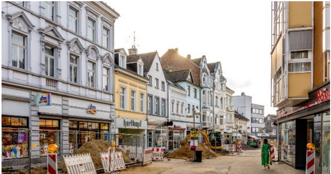
Abb. 1: Die Düsseldorfer Straße lebt von ihrem historischen Baubestand (Quellenangabe: eigene Darstellung)

Hier widmete sich die Verfasserin insbesondere der Düsseldorfer Straße, einer der ältesten Straßen des Stadtteils, die heute eine zentrale Einkaufsstraße darstellt (Stadt Solingen 2020, S. 9–14). Um aktuelle Entwicklungen einzubeziehen, wurde die Arbeit auf den Ohligser Markt erweitert, wo Ende 2022 ein großes Wohnbauprojekt abgeschlossen wurde. Diese Stadträume dienen nicht nur als Orte des Einkaufs, sondern auch als kulturelle und soziale Treffpunkte der Bewohner:innen (Stadt Solingen 2020, S. 11).